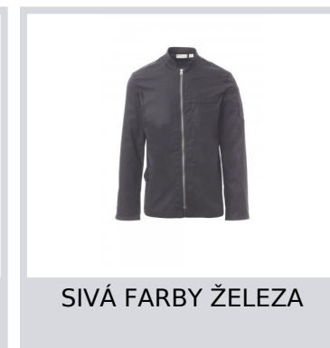
SIVÁ FARBY ŽELEZA