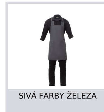
SIVÁ FARBY ŽELEZA