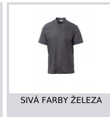
SIVÁ FARBY ŽELEZA