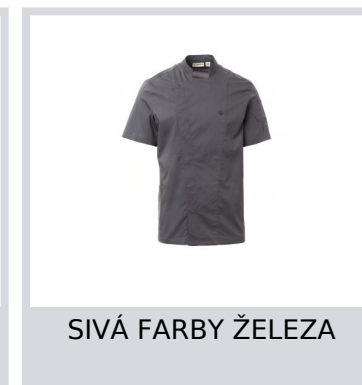
SIVÁ FARBY ŽELEZA