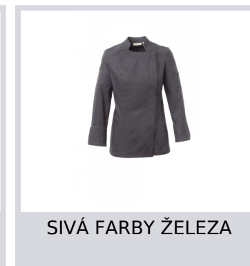
SIVÁ FARBY ŽELEZA