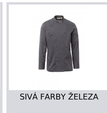
SIVÁ FARBY ŽELEZA