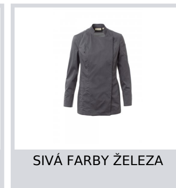
SIVÁ FARBY ŽELEZA