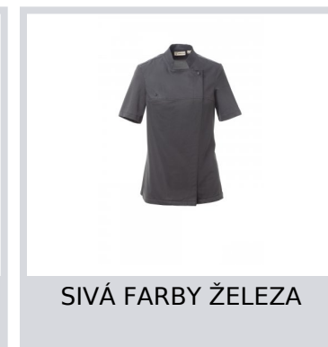
SIVÁ FARBY ŽELEZA