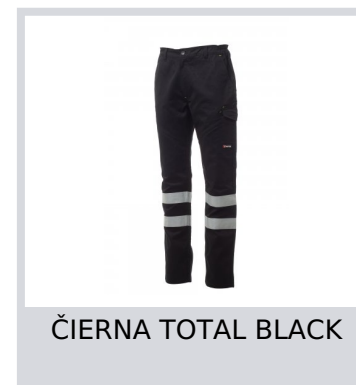
ČIERNÁ TOTAL BLACK